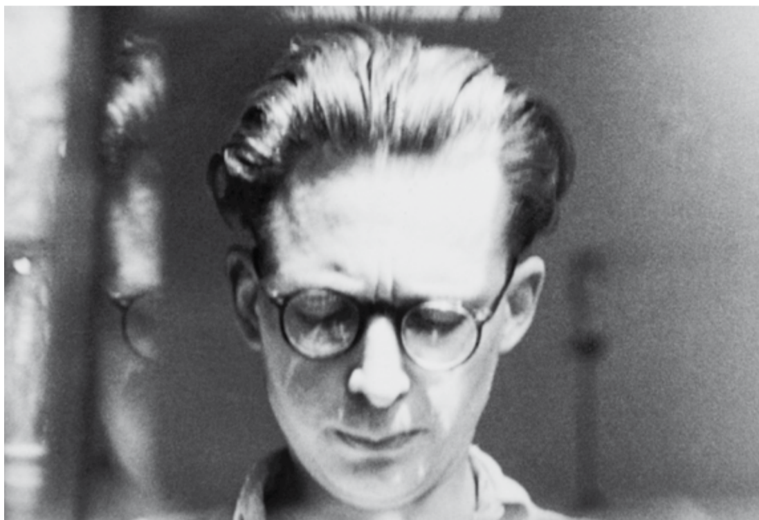
Andrzej Wróblewski, [Autoportret z odbiciem w szybie / Self-Portrait with Glass Reflection], ca. 1950, © Fundacja Andrzeja Wróblewskiego

The two days symposium will be divided in four sessions, with a panel discussion. The texts presented at the conference will be part of the publication which will accompany Andrzej Wróblewski's comprehensive exhibition planned at the Museum of Modern Art in Warsaw in autumn 2014.